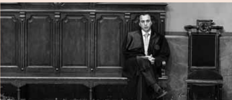
Se calcula que el convenio afectará a más de 25.000 abogados de los 118.775 ejercientes que hay.

previsto en el convenio de Oficinas y Despachos.